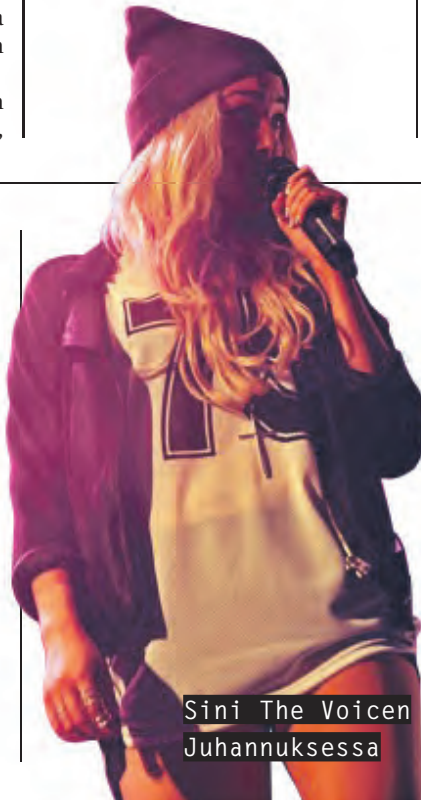
Sini The Voicen Juhannuksessa

www.trashdesign.fi Habitare Helsingin Messukeskuksessa 18.-22.9.2013