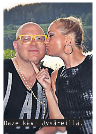
Daze kävi Jysäreillä.