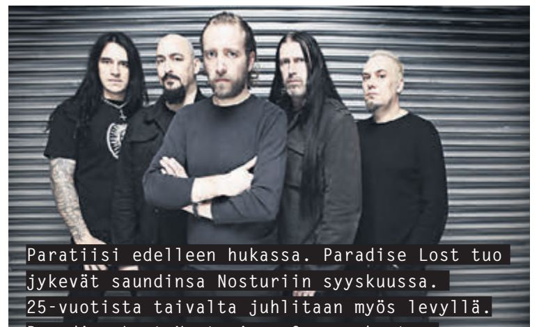
Paratiisi edelleen hukassa. Paradise Lost tuo jyrkät soundinsa Nosturiin syyskuussa. 25-vuotista taivalta juhliitaan myös levyillä. Paradise Lost Nosturissa 9. syyskuuta.

Taikkaa ja Stand uppia, Solmu, Cirko – Uuden Sirkuksen Keskus, Helsinki, pe 4.10., pe 8.11. ja pe 22.11.