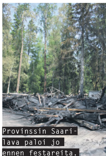
Provinssin Saarilava paloi jo ennen festareita.