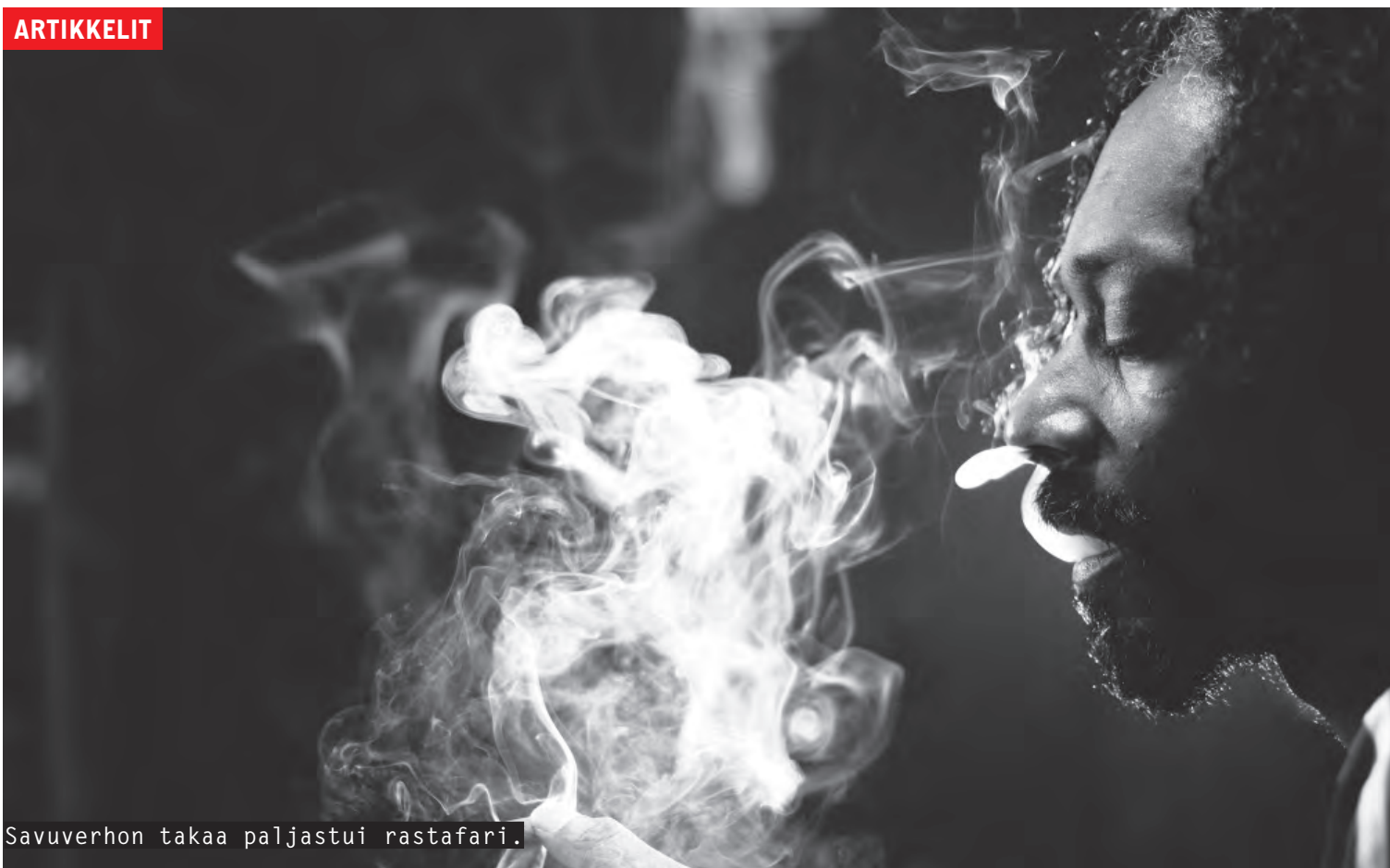
Savuverhon takaa paljastui rastafari.

Paksun viimeinen tanssi nähtiin elokuun puolessa välissä, kun irtaimisto huutokaupattiin.