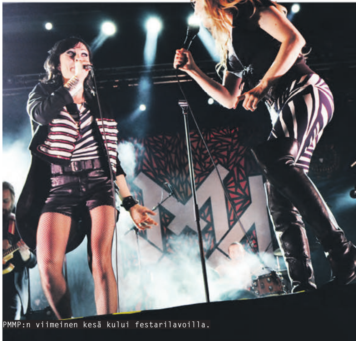
PMMP:n viimeinen kesä kului festarilavoilla.